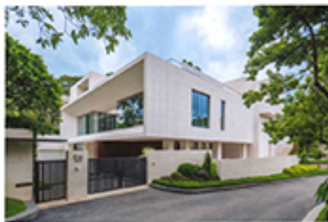
设计团队 | 毕达哥拉斯 项目 | 李煜强