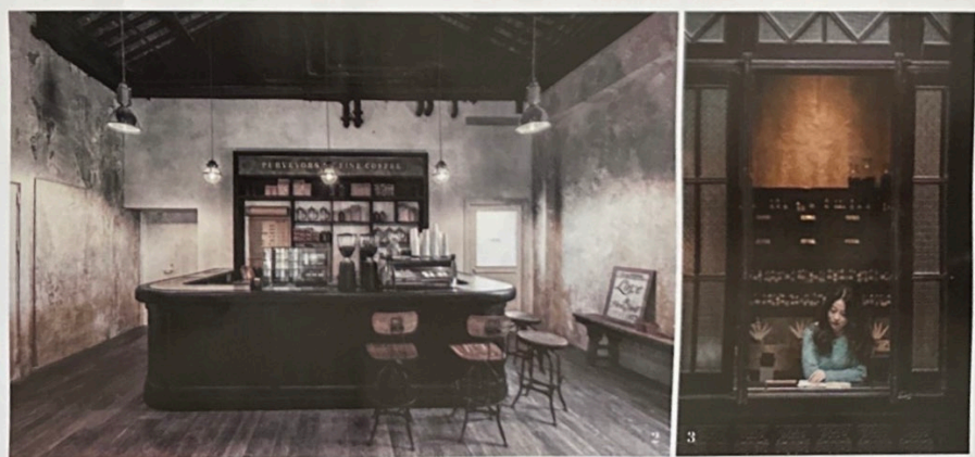
3. 图书区里精选了关于香水、手工制作、传统美学和生活方式类的书籍,消费者可在店内自由探索、阅读。

门店营业时间: 周一-周四 11:00-22:00 周五-周日 11:00-23:00 咖啡营业时间: 周一-周日 11:00-19:00 地址: 上海市太仓路181弄新天地北里25号