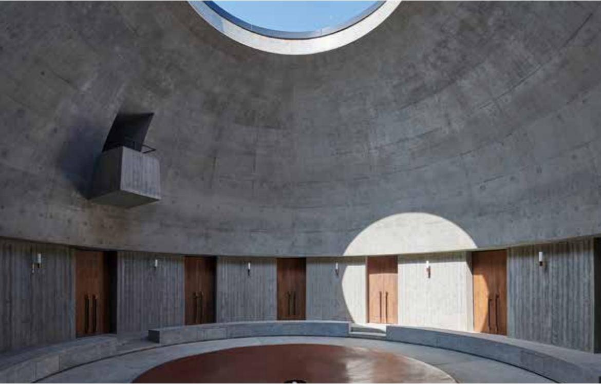
上起顺时针： 如恩设计充满中国传统哲学； 叠川酒厂内景； 深圳南头古城有熊酒店； 酒店外观； 无间设计“摩登东方”设计哲思； 杭城未来中心会所。